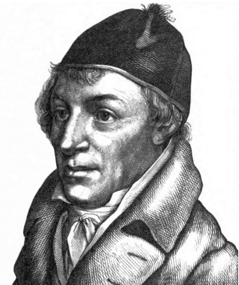
Johann Matthäus Bechstein