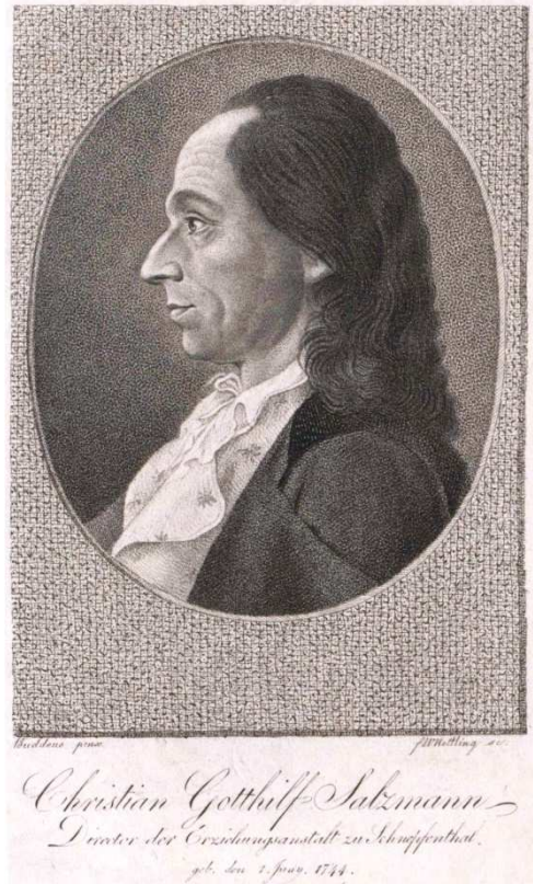
Christian Gotthilf Salzmann

Brünnben eredményes tevékenységet fejtett ki mindenekelőtt a természettudományos oktatás fejlesztése terén; ő írta Morvaországban az első útmutatót az ásványtan tanulmányozásához, az első statisztikát és a morvaországi ipar első áttekintését, megalapította továbbá a „Hazafias napilapot”, melyet azonban a jezsuiták és a rendőrség nyomására be kellett szüntetnie. Nagy érdemeket szerzett azzal, hogy ösztönözte a Brünn-környéki szén- és érckészletek kiaknázását és hasznosítását, ami a II. József türelmi rendelete nyomán Németországból bevándorolt