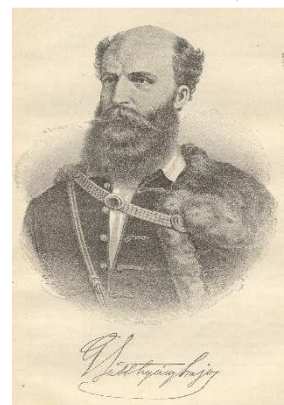
Gróf Batthyány Lajos